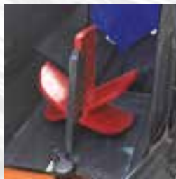
Cuchilla hidráulica 2-6.