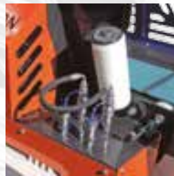
Conexiones para mesa de trabajo opcional.