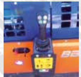
Joystick de control ergonómico.